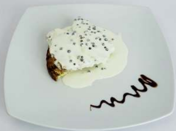
Mușchi de vită cu sos de piper verde