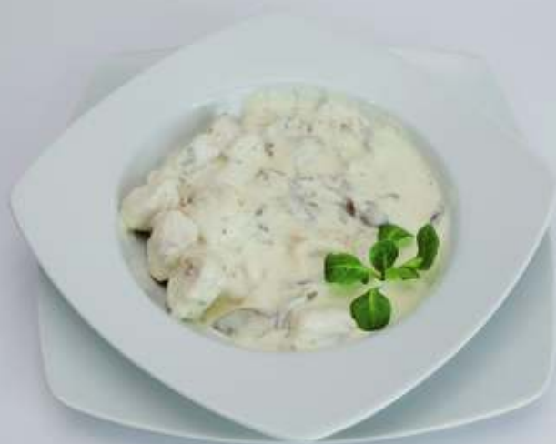
Piept de pui cu smântână și ciuperci

(A:7) Piept pui, smântână, ciuperci 150gr/120gr/50gr 41,00 lei